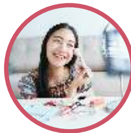
Dandanan personal untuk menjadi usahawan